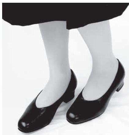
プレミアムパンプス

指先に沿ったゆとりのあるつま先の形状で、指を締め付けず疲れにくくなっています。なめらかでツヤのあるスムーズ革を使い、カジュアルながら上品なブーツです。