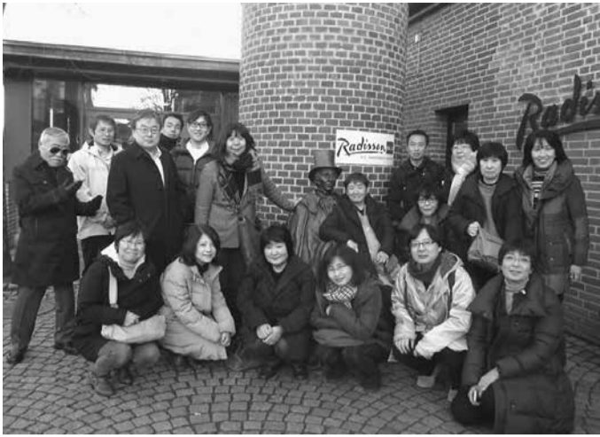
生活クラブ連合会「協同組合の旅」参加者18名。