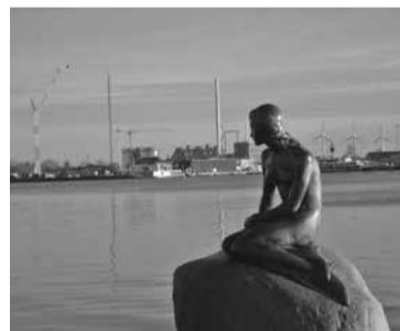
風車 (コペンハーゲン)

ム)だったところも2室を1室に改装して広くし、キッチンやシャワー・トイレも完備して住居(高齢者ローカルセンター)としています。ヘルパーになるには1年2ヶ月の教育を受けなければなりません。ヘルパーは専門性が重視されており、ほとんどが自治体に雇われた公務員です。高齢者の三原則(①継続性②それまでの生活を継続する③自己決定④自己資源の開発)を残能力の活性化を大切にしており、かゆい所に手が届く介護はその人にとって良くないと考えら