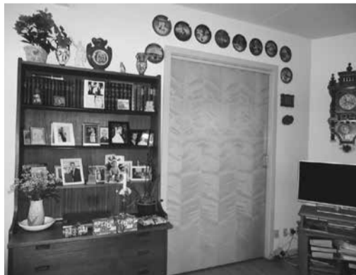
高齢者ローカルセンター (ボーゲンセ市)

ム)だったところも2室を1室に改装して広くし、キッチンやシャワー・トイレも完備して住居(高齢者ローカルセンター)としています。