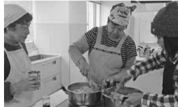
鍋ふとんで包む前に、下ごしらえをします。

鍋ふとんを持っていない人のために、代用として新聞紙3枚ほどで鍋をくるみ、その上からさらに厚めのひざかけやガウン(くるんで保温するものなら何でも良い)でくるんで保温する方法でも実践してみました(写真A)。メニューは、ミネストローネ、フラン(洋風茶碗蒸し)、ごはん、プリンです。この保温調理でごはんを炊く方法を覚えれば、非常時にとっても役立つこと間違いなしです。そのことを伝えると参加者の方も「なるほど!」と感心されていました。また、フランとプリン作りでは、