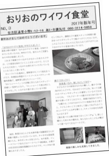
阪野さんが関わっている「おりのワイワイ食堂」(大阪市住吉区)

※街づくり夢基金…エスコープ大阪の呼びかけで設立された、街づくりをおこなう非営利団体を応援する基金 【ホームページ】 http://www.yumekikin.com/