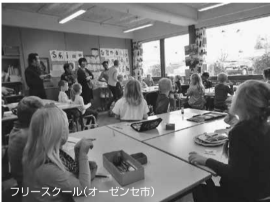
フリースクール(オーゼンセ市)

とする「運営委員会」が設置されており、子どもたちの学校生活が充実したものになるように、生徒や保護者や職員がお互いに意見を出し合い、教育方針などを決定しています。