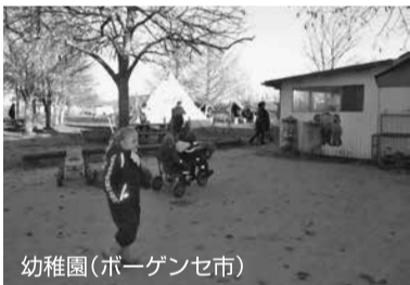
幼稚園(ボーゲンセ市)