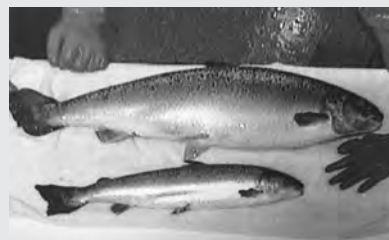
上が遺伝子組み換えサケ、下が通常のサケ

2015年11月19日(木)米国FDA(米国食品医薬品局)がGMサケの流通を承認しました。飼料などと違い直接口に入れるものである上に、動物は自ら動くことができ、その危険性は計り知れません。日本に入ってくるのも時間の問題かも!?