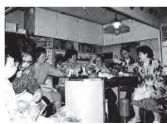
ネットワークゆう

組合員の有志によるたすけあい「ネットワークゆう」誕生 それまで生協は「食」を提供するだけだったが、「生協の中でたすけあいの輪を広げたい」と思った組合員たちが、日常の中で困ったことのお手伝いを行なう団体を作りました