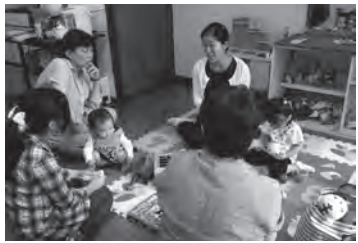
親子でほっこり「子育てひろば」

このようにその時の組合員の暮らし方に合わせ、さまざまなたすけあいのしくみを作ってきました。今、みなさんの暮らしの中で「困った」「やりたい」「ほしくない」が、いっしょに解決して、「ケアの自給」をすすめていきます。