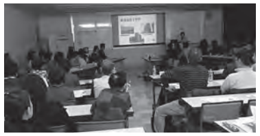
豊かな街づくりを行うための応援基金「街づくり夢基金」